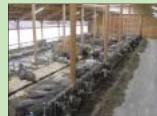
Der neue Laufstall mit 60 x 20 m wurde 2001 bezogen. Gemolken wird im 2 x 6er-Fischgräten-Melkstand. Die Fressgangbreite beträgt 4,50 m, die Laufflächen sind planfest mit Gussasphalt, Tiefboxen, Curtains.

Mehr über Brown-Swiss-Zucht und Urlaub auf dem Bauernhof in Münsing gibt es im Internet unter www.bruckmeir-muensing.de JB