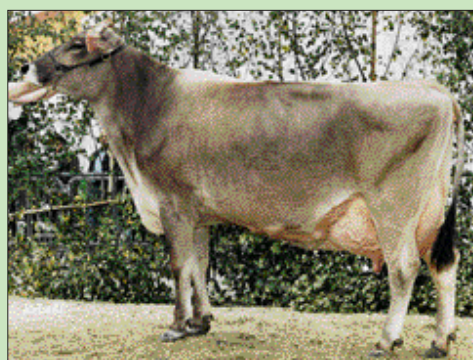
Jetway-Tochter Sindi beim ZLF 2000.

ne standen und stark in der Population verankert wurden. Dabei würden Stiere wie Jupater (M) oder Starbuck und seine Söhne gerade in der eiweißstarken deutschen Population gute Arbeit leisten, so Bruckmeir.