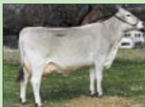
Videv Sandra aus dem anderen S-Stamm.