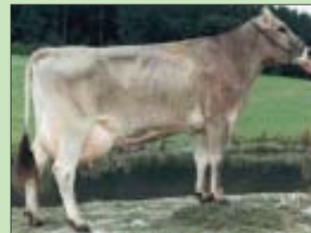
Prophet-Tochter Sunlight.